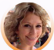
Pr Aurélia GAY Saint-Etienne