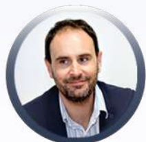
Pr Benjamin ROLLAND Lyon