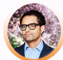
Pr Amine BENYAMINA Paris