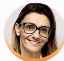
Pr Hélène DONNADIEU Montpellier